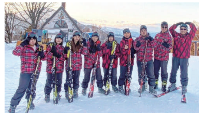
與日本名城大學合作滑雪營