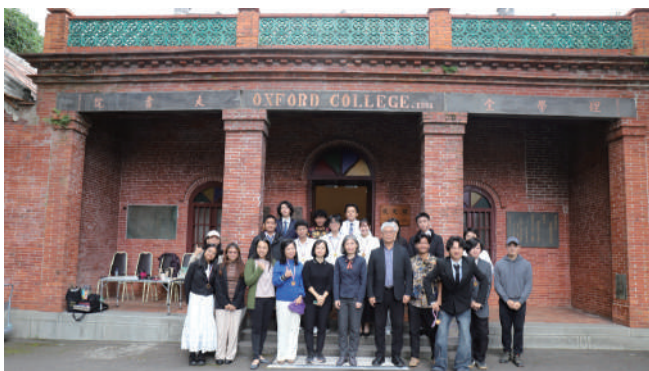
第一屆au多語導覽比賽競賽師生合影