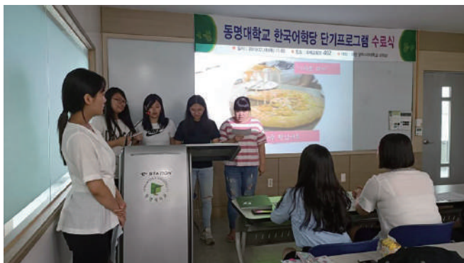
真理學生於韓國東明大學韓語課程上課實況

舉辦多場華語與英語語言競賽活動，融合AI科技、雙語主持、主題導向學習，鼓勵外籍學生使用華語發表簡報，外籍學生在以華語發表的同時，比較台灣與自身國家的文化差異，而本地學生透過英語轉譯，強化自身的語言轉換能力，並進一步理解不同文化的表達方式。辦理牛津學堂古蹟導覽競賽，鼓勵校內學生透過華語與英語進行歷史導覽，如何精確且生動地向國內外遊客介紹台灣文化與歷史場域。透過活動，提升學生跨語與跨文化溝通力。鼓勵學生以語言呈現文化觀察與國際視角，深化學術與社會實踐能力。