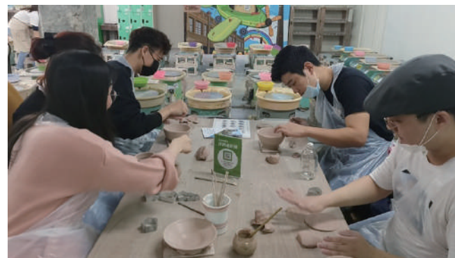
真理大學境外生三峽手拉坯體驗活動