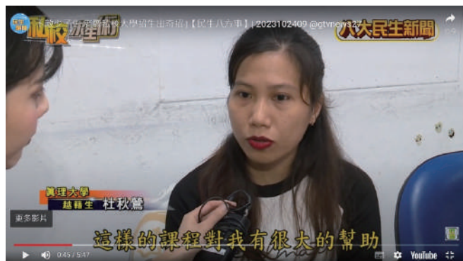
華語文中心外籍生華語課程