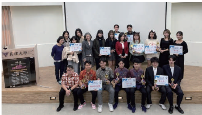
外籍生與本地生詩歌散文朗讀比賽