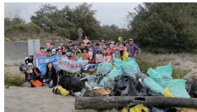
真理大學曾文社大淨灘活動