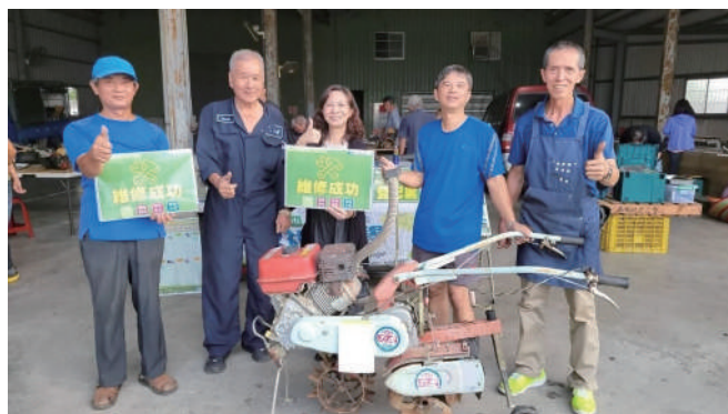
曾文社大農機具義診活動