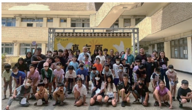
真理真友原公益夏令營