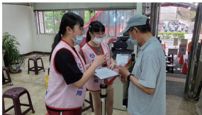
真大學生助民眾報稅