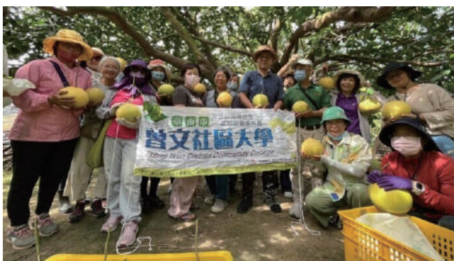
曾文社大「柚見未來」食農課程