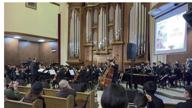
淡古館x真理大學音樂會