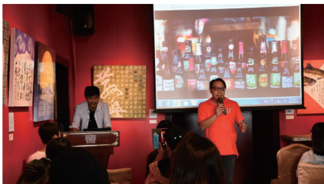
淡水老街的新味道：返農與文創行銷

本校與新北市立淡水古蹟博物館合作舉辦音樂會，開放民眾進入本校大禮拜堂，聆賞全國第四大管風琴的絕美音色，本校更提供「淡古×真理」的住房專案抽獎券，及同步開放國定古蹟「理學堂大書院」，共同推動永續城鄉與地方共榮。