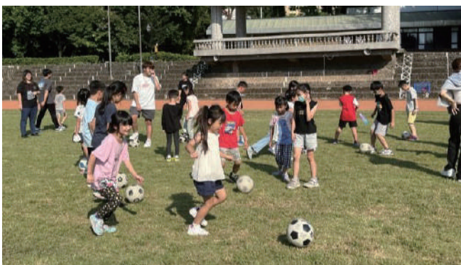
真理大學進修推廣兒童夏令營